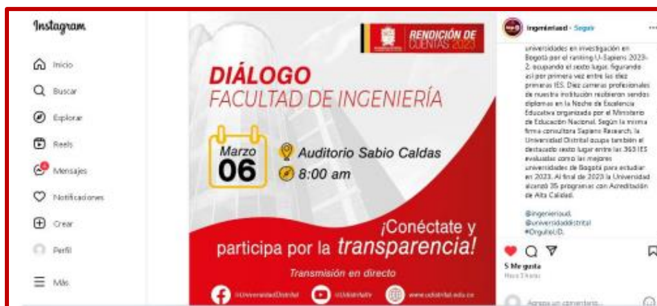
Publicación en el Instagram de la Universidad Distrital Oficial