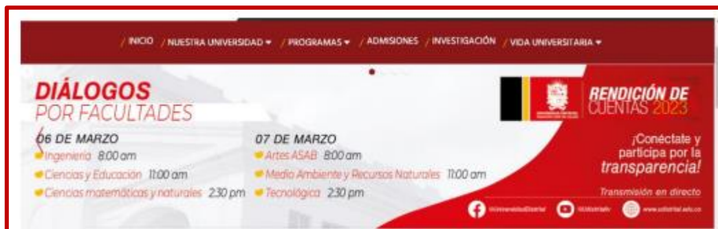
Publicación en la página web institucional

La Estrategia de Comunicación y Divulgación fue concreta en tener presencia en cada uno de los medios virtuales de la Institución, siendo así las redes sociales como Facebook, X e Instagram un gran apoyo como medio de divulgación de los espacios de Rendición de Cuentas, por lo anterior, las imágenes oficiales publicitarias de la Rendición de Cuentas tuvieron presencia en las redes institucionales, emisora y facultades, la divulgación de las piezas se inició desde el 4 de marzo y se extenderá hasta el 14 de marzo.